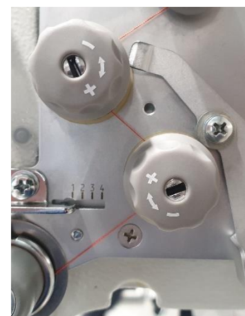
Garenspanningen / Draadspanning regelknoppen