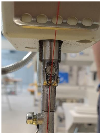
Draadgeleiding Aan naaldstang