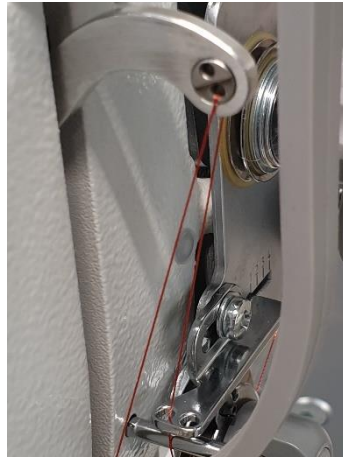
Draadgeleiding & -hevel Inrijgen