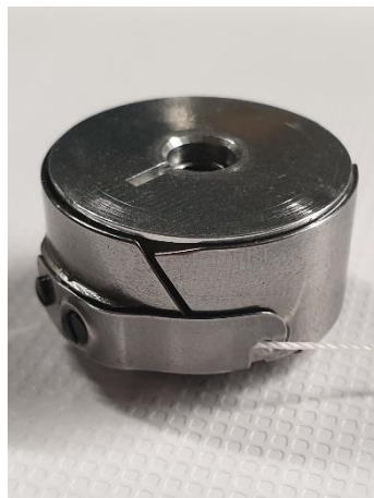
Garen in sleuf naar Voren tussen klemveer