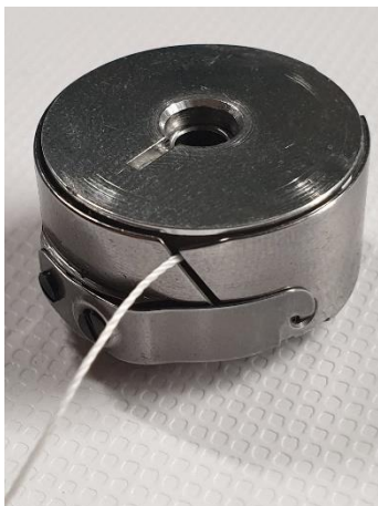
Spoel in spoelhuis Klok rotatie