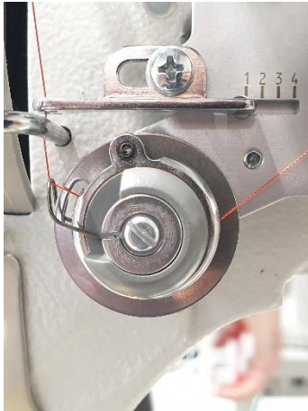
Aantrekveer Draad doorhalen tot klik

Branskamp 1 NL-6014 CB Ittervoort Postbus 3713 NL-6014 ZG Ittervoort Tel.: 0475 - 566 464 Fax: 0475 - 566 485 E-mail: info@vinkenservice.nl Website: www.vinkenservice.nl