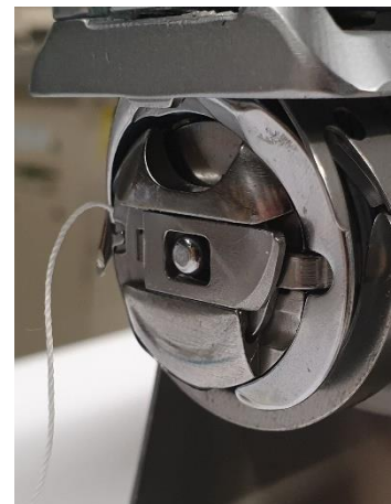
Spoel met spoelhuis Inleggen in grijper