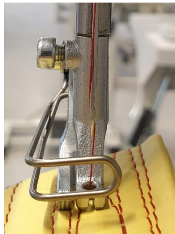
Inrijgen naald Van links naar rechts