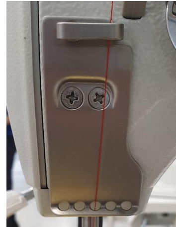
Draadgeleidingen Draad doorhalen